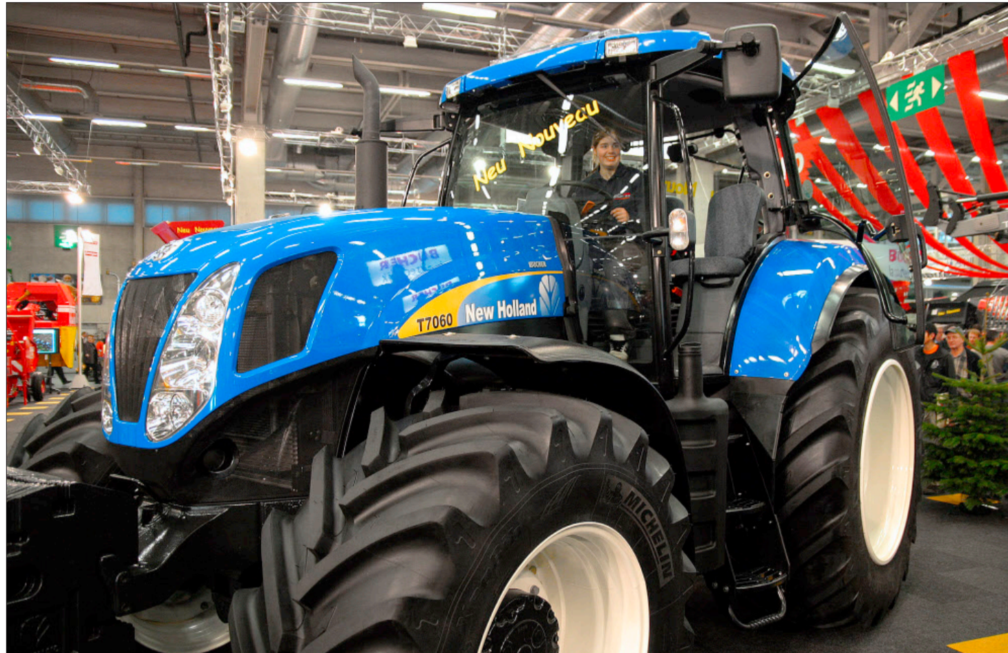
New Holland führt die Schweizer Traktoren-Zulassungsstatistik an.

rem damit, dass sich die Zahlen auf diesem Niveau einpendeln», erklärt Schürch. Wenn es immer weniger Bauernbetriebe gebe, könne man auch nicht mehr Traktoren verkaufen. Zudem löse die gestiegene Nachfrage nach Agrargütern bei den Bauern nicht explizit eine hohe Investitionsbereitschaft aus. Festzustellen sei aber schon, dass die Stimmung insgesamt wieder etwas besser sei, die Traktorverkäufe werden deswegen aber nicht rasant steigen.